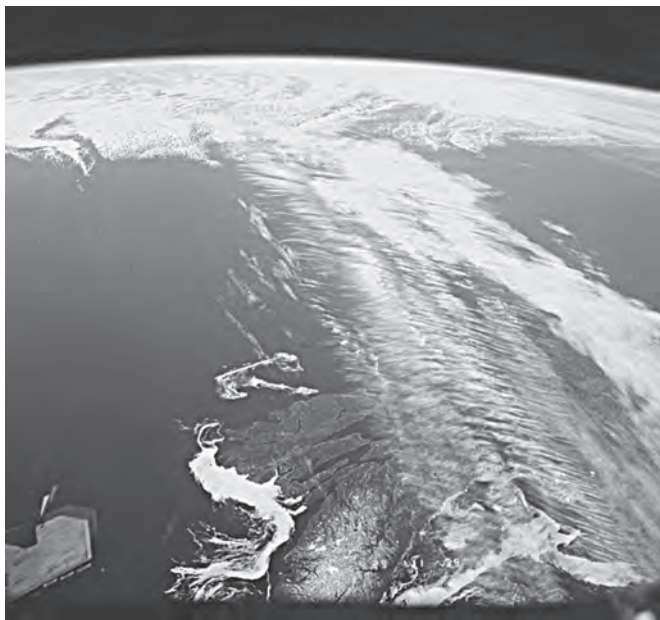
Imagen 1: Vista de las corrientes en chorro arrastrando un sistema nuboso.