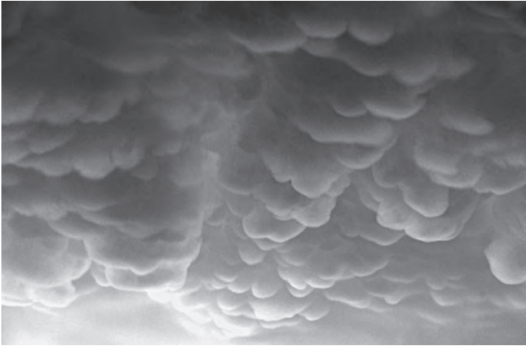
Imagen 9: Mamma fotografiada sobre la ciudad de Rosario, Argentina.

en forma de bolsas similares a pechos, lo que da lugar a su nombre (imagen 9).