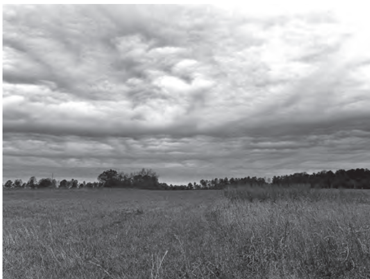
Imagen 6: Distintos tipos de nubes: cúmulos (arriba), nimboestratos (abajo).