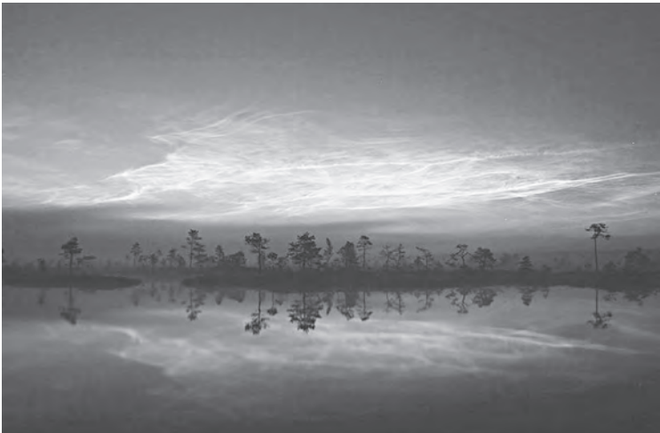
Imagen 2: Nubes noctilucientes sobre el parque nacional Soomaa, Estonia.

Debido a esas bajísimas temperaturas, presenta (al igual que la troposfera y, en menor medida, la estratosfera) un tipo muy particular de nubes, las nubes noctilucientes o nubes mesosféricas polares, que se llaman así porque sólo pueden verse durante el crepúsculo en latitudes cercanas a los polos (si tienen un mapamundi cerca, esto sería un poco antes de los círculos polares). Como se encuentran muchísimo más alto que cualquier otra nube, a casi 80 kilómetros de la superficie terrestre, están formadas por cristales de hielo y sólo son visibles cuando las otras dos capas están ocultas por la sombra del planeta y las últimas luces del Sol se reflejan en esos cristales (de ahí que sean luminosas) (imagen 2).