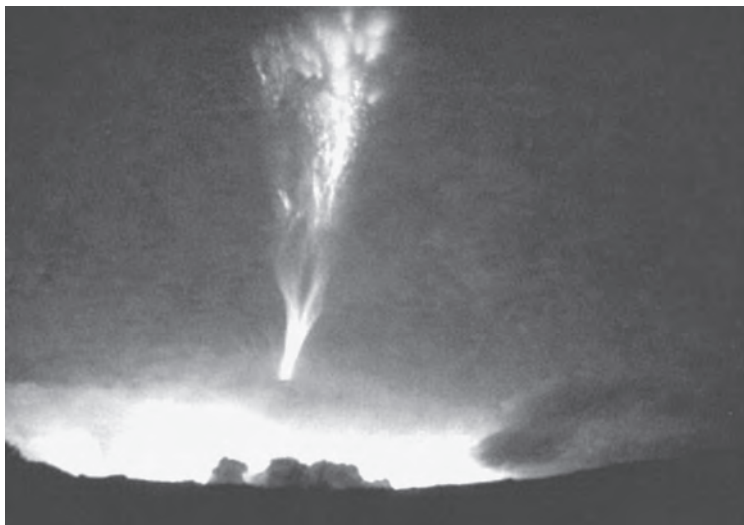
Imagen 18: Un chorro gigante sobre una tormenta en la isla La Reunión.

Los chorros gigantes, por su parte, conforman una suerte de híbrido entre un chorro azul y un duende, pues se originan en la nube, como los chorros azules, pero la forma de su parte superior es similar a la de los duendes. Duran más que el resto (de 200 a 400 milisegundos) y se expanden hasta unos 90 kilómetros, de manera que recorren prácticamente cuatro de las cinco capas de la atmósfera (imagen 18). 61