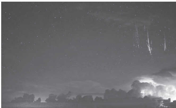
Imagen 16: Duendes en el Lago Balaton, Hungría.

una parte superior voluminosa y una estructura de filamentos, en la parte inferior, y su ancho abarca decenas de kilómetros. Lo curioso de los duendes es que no surgen de la parte superior de la nube, sino que se inician a 50 kilómetros de altura, casi al comienzo de la mesosfera, crecen hacia arriba hasta alcanzar los 90 kilómetros de altitud, donde ingresan en la termosfera, mientras que sus ramificaciones, hacia abajo, parecen producir algún tipo de descarga sobre la nube (imagen 16). 54