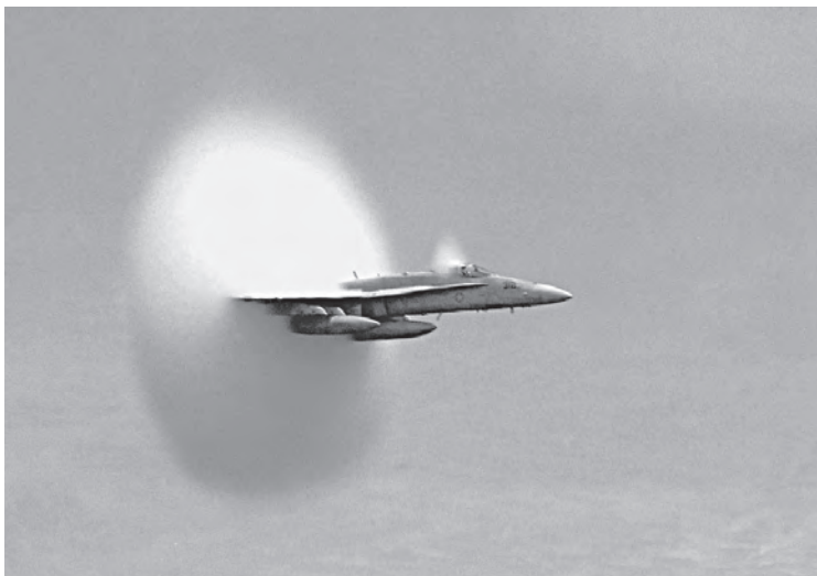
Imagen 4: Singularidad de Prandtl-Glauert causada por un caza F-18 al cruzar la barrera del sonido.

Si alguna vez vieron volar un avión supersónico (es decir, aquel que supera la velocidad del sonido), sin duda habrán notado que el sonido que se escucha proviene del lugar por el cual la aeronave ya pasó. Cuando un vehículo alcanza la velocidad del sonido, se produce una variación extrema de presión que produce un estallido momentáneo que puede percibirse a cierta distancia. Además, si el aire está suficientemente húmedo, suele condensar el vapor de agua generando una nube alrededor del avión, efecto que se conoce con el complicado nombre de singularidad de Prandtl-Glauert (imagen 4).