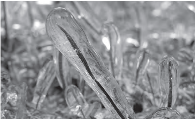
Imagen 15: Efecto de la lluvia engelante sobre la vegetación.