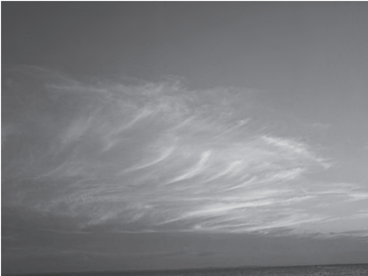
Imagen 7: Distintos tipos de nubes: cumulonimbo (arriba) y cirros (abajo).