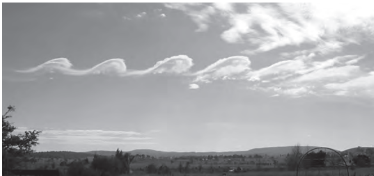
Imagen 12: Nubes Kelvin-Helmholtz en el Monte Duval, Australia.