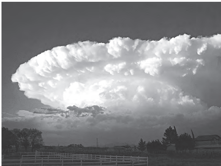
Imagen 13: Una supercelda sobre Nuevo México, Estados Unidos.

Los tornados se encuentran entre los vientos de nuestro planeta que pueden alcanzar mayor velocidad y llegan a valores que superan los 500 kilómetros por hora. 37