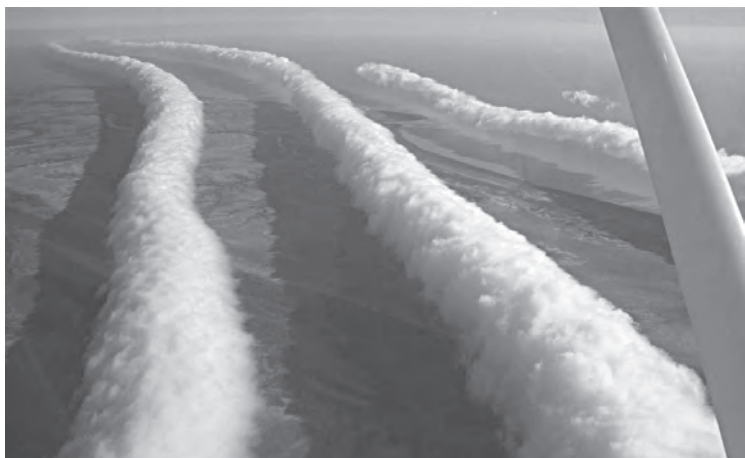
Imagen 8: Nubes morning glory en la zona de Burketown, Australia.