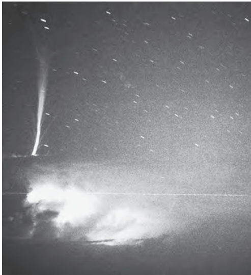
Imagen 17: Un chorro azul sobre una tormenta en la isla La Reunión.

luz azul que muy raras veces surgen de los topes nubosos de las tormentas y pueden ser causados tanto por rayos positivos como negativos. 60 Su velocidad alcanza los 120 kilómetros por segundo y han llegado a remontarse hasta los 45 kilómetros de altitud (imagen 17). El color azulado de los chorros se atribuye a la ionización del nitrógeno de la atmósfera circundante. Su estudio es mucho más complicado que el de los duendes y otros fenómenos mesosféricos porque se originan en la nube misma. Entre estos chorros azules, los más pequeños, es decir, aquellos que sólo alcanzan hasta 25 kilómetros de altitud, se denominan iniciadores azules ( blue starters , en inglés).