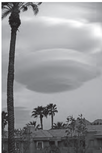
Imagen 11: Nube lenticular sobre Palm Desert, California, Estados Unidos.