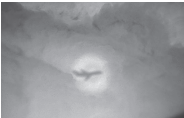
Imagen 5: Anillos de Ulloa o glorias: alrededor de la sombra del fotógrafo (arriba), y alrededor de la sombra del avión desde el que fue fotografiada (abajo).