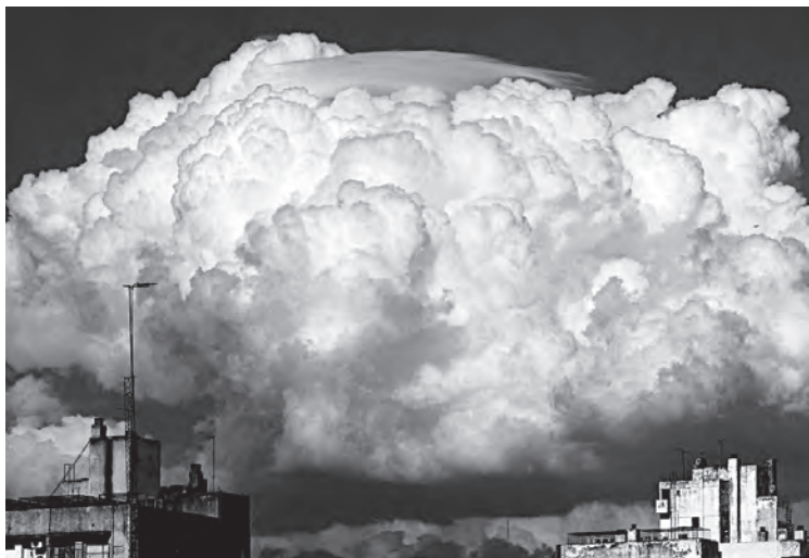
Imagen 10: Una nube pileo encima de un cúmulo sobre la ciudad de Rosario, Argentina.