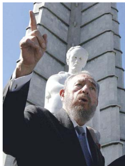
Fidel Castro, líder histórico de la Revolución Cubana, durante un discurso en La Habana.

La tarea de repensar la democracia es urgente, incluyendo su articulación con el proceso de globalización económica, social, política, cultural e ideológica neoliberal. La articulación entre Estado (mínimo) y grupos empresarios es una de las formas que adquiere ese proceso. Otra manifestación es la opción prioritaria del crecimiento económico por sobre la democracia, elección indicativa de un triunfo ideológico del neoliberalismo, que privilegia la primacía del mercado en la definición de los mecanismos de crecimiento económico, mas no de desarrollo económico-social, postergando la extensión y profundización de los derechos democráticos. El problema es, pues, el de la colisión entre intereses económicos y valores político-sociales democráticos. En sociedades con una historia de burguesías de rapiña, sin actores democráticos fuertes y con ciudadanos licuados, una política tal amenaza fuertemente el futuro inmediato de la democracia, aun cuando algunos procesos