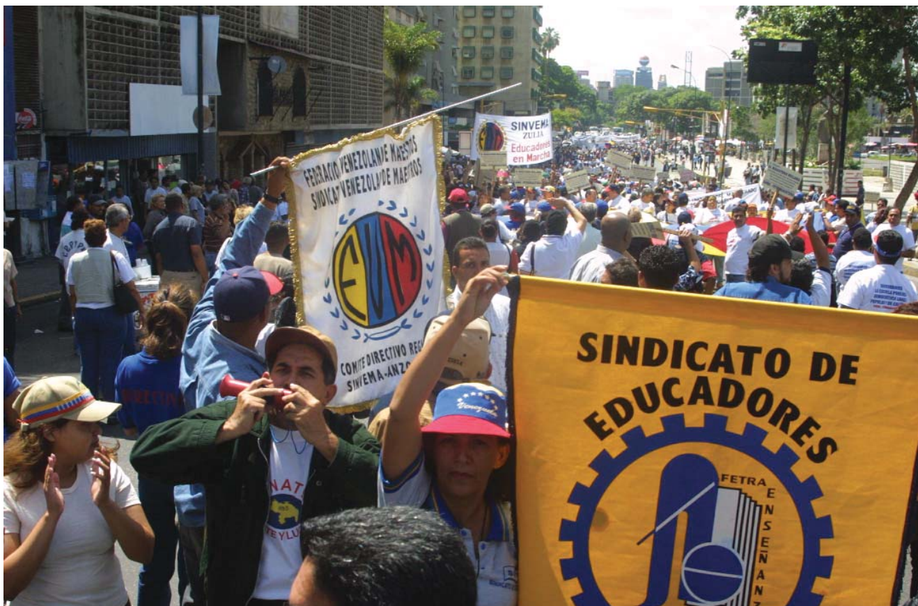
Manifestantes en el golpe de Estado fallido contra el presidente de Venezuela, Hugo Chávez, en abril de 2002.

La historia de la región muestra que, por distintas razones, tanto las clases subalternas —proletarios, trabajadores, campesinos, las clases medias urbanas—, como las clases propietarias (sean burguesías o no) no siempre hicieron y/o hacen de la democracia un horizonte político deseable, una conquista