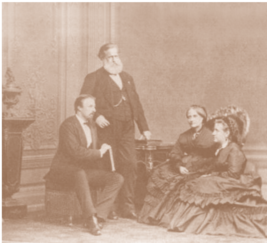
Pedro II, emperador de Brasil entre 1831 y 1889.

El largo y tortuoso proceso de construcción de los Estados y las sociedades latinoamericanas posterga y/o resignifica el ideal de la democracia política. Es decir, se establece el principio de la soberanía residiendo en la nación (más que en el pueblo), la división tripartita de los poderes, la forma representativa, incluso el sufragio universal