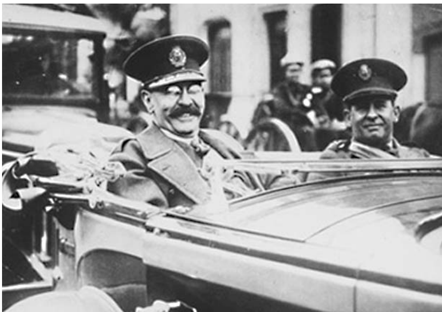
José Félix Uriburu derrocó a Hipólito Yrigoyen el 8 de septiembre de 1930 e inauguró la larga historia de gobiernos de facto en la Argentina.