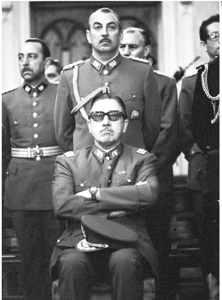
En 1973, el general Augusto Pinochet, con el apoyo de los Estados Unidos, derrocó el gobierno chileno del socialista Salvador Allende, quien se suicidó durante el bombardeo de la Moneda.

externos (internacionales). Simples porque el procedimiento general es una solución de negociaciones tomada en el vértice, por las direcciones de los partidos políticos, eventualmente de las organizaciones representativas de intereses (sean de masas, como los sindicatos obreros, o más restrictivas, pero también más poderosas, como las de la burguesía), y las conducciones militares. En tales salidas, las masas — pese a su importante papel en las luchas antidictatoriales— son marginadas. Es decir, la lógica de las transiciones es igual o similar, pero la historia de cada una de ellas es diferente e, incluso, específica.