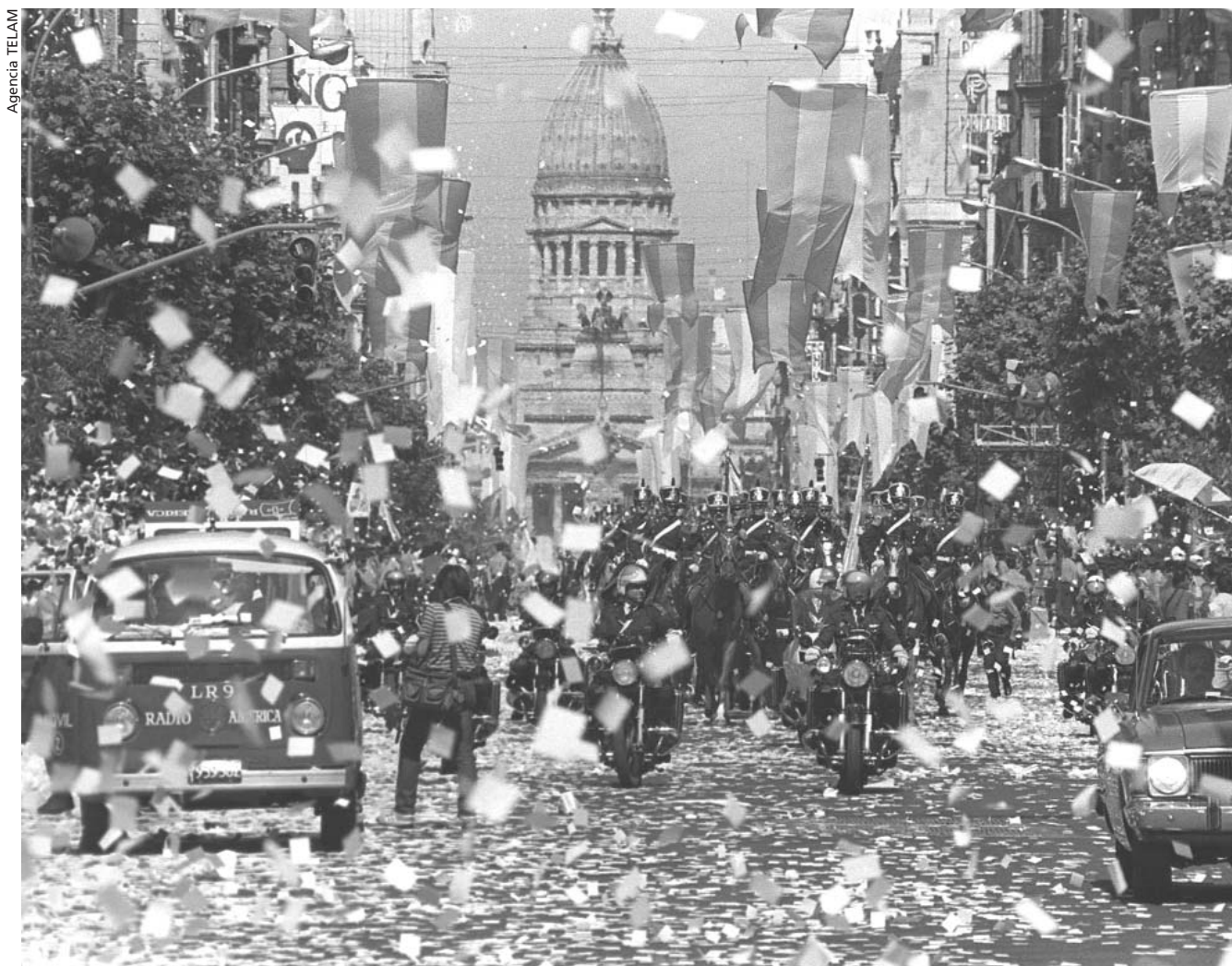
La Avenida de Mayo el día que Alfonsín asumió la presidencia de la Argentina, 10 de diciembre de 1983.