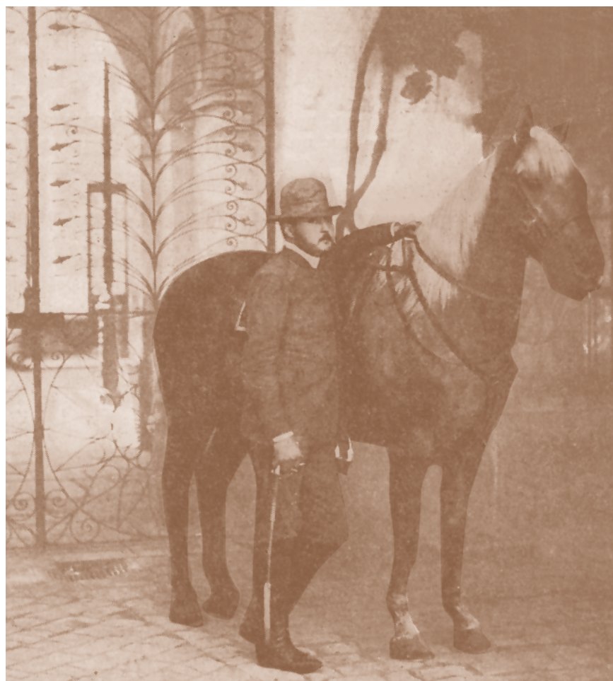
Estanciero de la provincia de Buenos Aires de fines del siglo XIX.

mengua de coexistencias en ambas dimensiones. La plantación surge a comienzos del siglo XVI; la hacienda, a principios del siglo XVII, y la estancia, a fines del siglo XVIII. La primera se encuentra en el Caribe (Antillas mayores y menores, parte del litoral del golfo de México, costas de Belice, costas y valles aledaños de Venezuela), el nordeste brasileño (y luego las áreas cafetaleras, hacia el centro sur del país), las Guayanas, partes de Colombia y la costa de Perú, y persiste hasta la abolición de la esclavitud, durante el siglo XIX. La hacienda abarca una superficie mayor, desde México hasta el noroeste argentino y Chile central, especialmente en las áreas andinas; su notable capacidad de adaptación a las transforma-