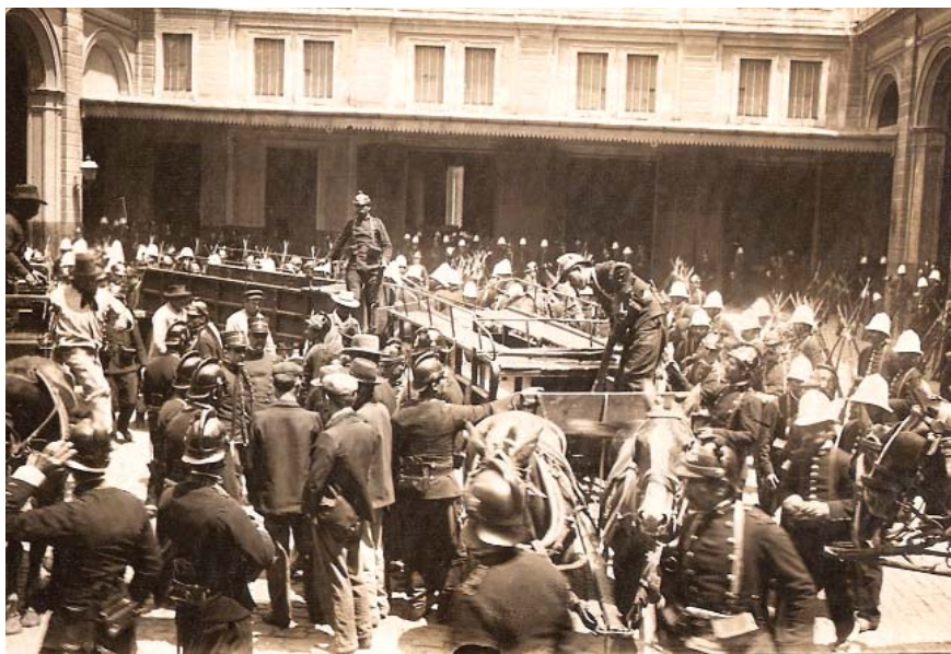
El levantamiento cívico-militar de la Unión Cívica, conocido como Revolución del Parque (1890), apelaba a una democratización del régimen político. Si bien fue sofocado, provocó la caída del presidente Juárez Celman.