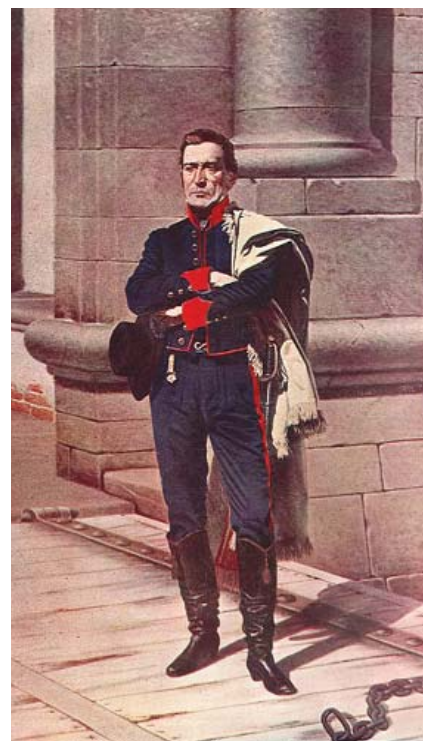
José Artigas en la Ciudadela, Montevideo, Uruguay, según la pintura de Juan Manuel Blanes de 1884.

Con todo, el liberalismo de la fase de ruptura del nexo colonial elabora algunas preceptivas que, aunque minoritarias y fugaces,