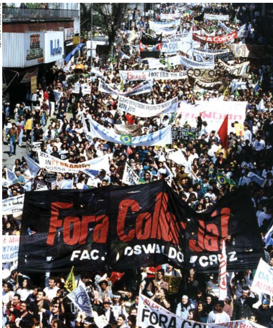
Manifestación en favor de la destitución del presidente de Brasil, Fernando Collor de Mello, el 28 de agosto de 1992.

Mirada desde una perspectiva meramente institucional, la apariencia muestra, desde 1980, una consolidación de la democracia. Pero se trata sólo de una formalidad: hay elecciones periódicas, en muchos casos limpias y transparentes, si bien todavía persisten mecanismos clientelares e, incluso, algún caso de fraude; hay alternancia de partidos en el ejercicio del gobierno, incluso en México, donde la hegemonía absoluta del Partido Revolucionario Institucional (PRI) se había prolongado a lo largo de siete décadas, configurando lo que algu-