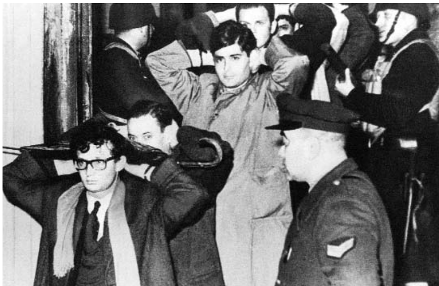
La noche del 29 de julio de 1966, el gobierno de facto del general Juan Carlos Onganía reprimió a profesores y estudiantes universitarios e intervino las universidades nacionales, a las que consideraba centros de difusión del comunismo.

Por otra parte, el Departamento de Estado estadounidense invoca fuertemente la democracia política, más como forma de contener ese potencial "amenazante" de la estabilidad de la región —ya sea el comunismo o las experiencias populistas— que como una pretensión genuina. En efecto, y a despecho de esa apelación, nadie conculca más fuertemente la posibilidad del ejercicio de la democracia política liberal que la propia poli-