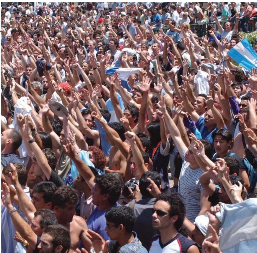
Asamblea de las asambleas vecinales en Parque Centenario, Buenos Aires, enero de 2002.

a lograr. A su turno, las experiencias con mayor acción transformadora —las populistas del cardenismo mexicano, el varguismo brasileño y el peronismo argentino, y las revolucionarias de México (1910), Bolivia (1952) y Cuba (1959)— fueron mucho más efectivas en integrar las clases subalternas a la nación y a derechos de ciudadanía, sobre todo social, que en generar experiencias democráticas perdurables, en tanto espacio para dirimir y procesar disensos.