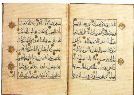
El libro sagrado del Islam es el Corán (palabra que significa recitación). El Corán reúne los fundamentos de la religión musulmana revelados por Alá a Mahoma y está escrito en lengua árabe.

La nueva religión fue llamada Islam , que en árabe significa " sumisión " y sus seguidores son los musulmanes , término que significa " sometidos a la voluntad de Dios ".