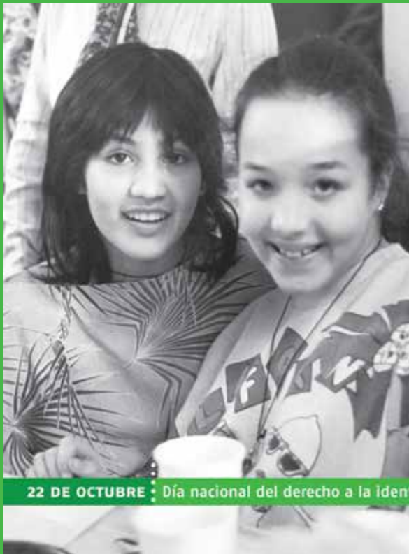
22 DE OCTUBRE : Día nacional del derecho a la identidad

“ La identidad es vital. El primer derecho que debe tener un ser humano es que los padres le den un nombre y un apellido, es la herencia que te dejan. ”