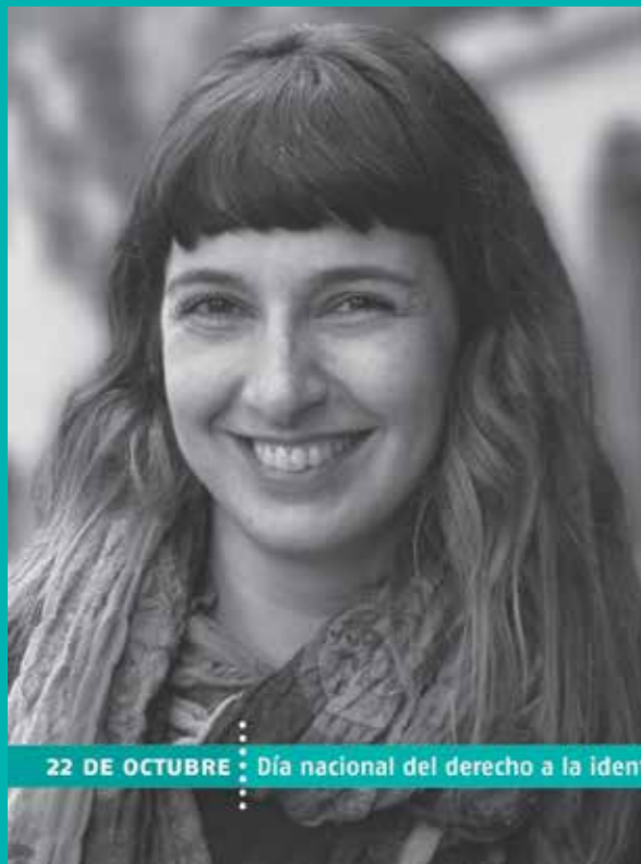
22 DE OCTUBRE : Día nacional del derecho a la identidad