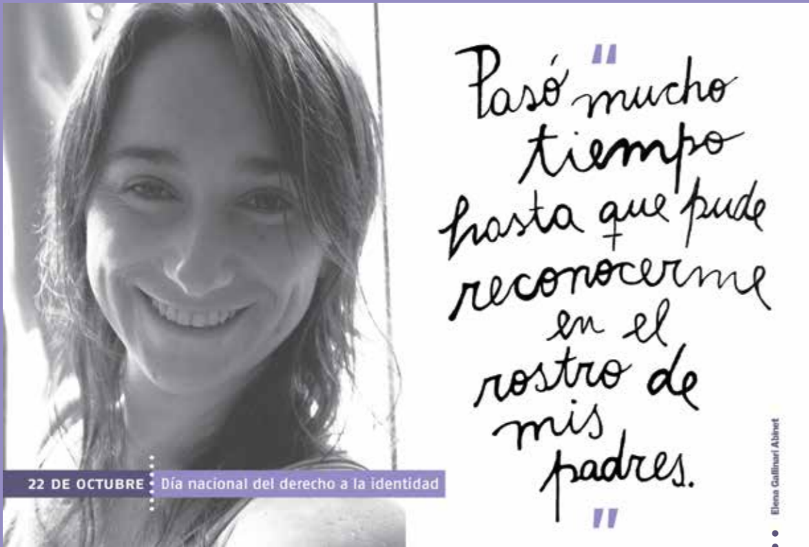
22 DE OCTUBRE · Día nacional del derecho a la identidad