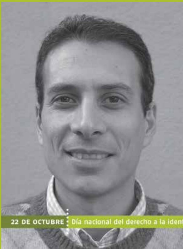
22 DE OCTUBRE Día nacional del derecho a la identidad

“ En cierto sentido era como en la película “The Truman Show” había como una especie de pacto de silencio en el barrio, en la familia. Todos sabían menos yo. ”