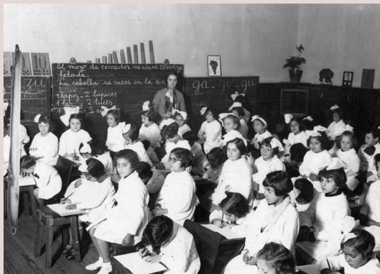
Escuela Tomasa de la Quintana de Escalada. Villa Crespo, 1935, AGN.