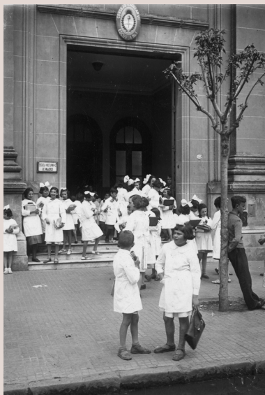
Hora de ingreso en la Escuela nocturna de mujeres Villa Crespo, s. f., AGN.

* Observen las fotografías y luego realicen las actividades.