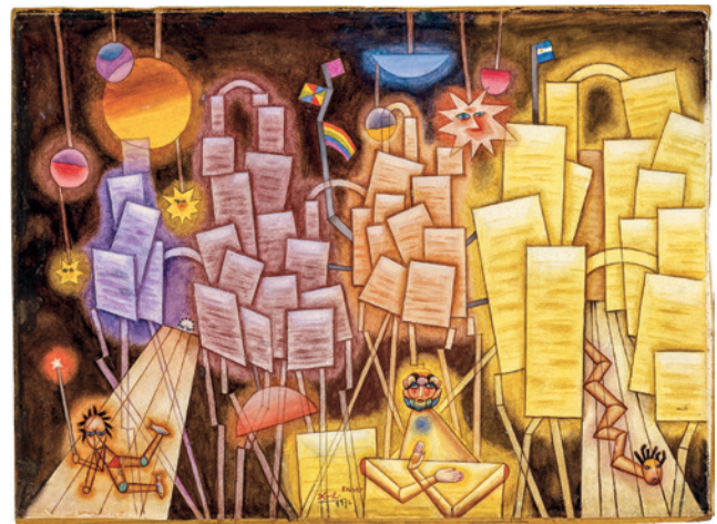
← ↑ Xul Solar, Proa , 1925, acuarela sobre papel, 50 × 33 cm, Museo Nacional de Bellas Artes