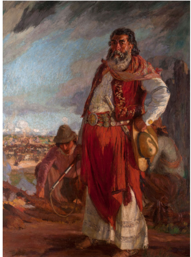
Cesáreo Bernaldo de Quirós, Don Juan Sandoval ( El patrón ) (Serie Los Gauchos ), ca. 1926, óleo sobre tela, 210 × 148 cm, Museo Nacional de Bellas Artes

En Europa, en cambio, para esos años ya se había emprendido una importante renovación de los lenguajes a través de las primeras vanguardias.