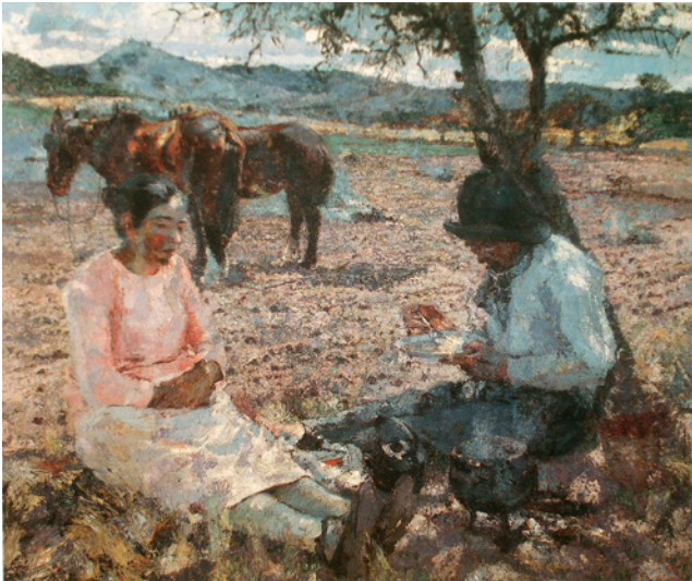
↑ → Fernando Fader, La mazamorra , 1927, óleo sobre tela, 100 × 120 cm, Museo Nacional de Bellas Artes